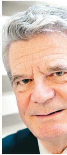
Joachim Gauck stod i händelsernas centrum när Berlinmuren föll för 20 år sedan. Sedan dess har han bland annat haft hand om Stasi-arkivens avveckling. Nyligen talade han på Södertörns högskola.

Herrarna har lärt känna varandra och först kunde inte Schabowski förstå att han