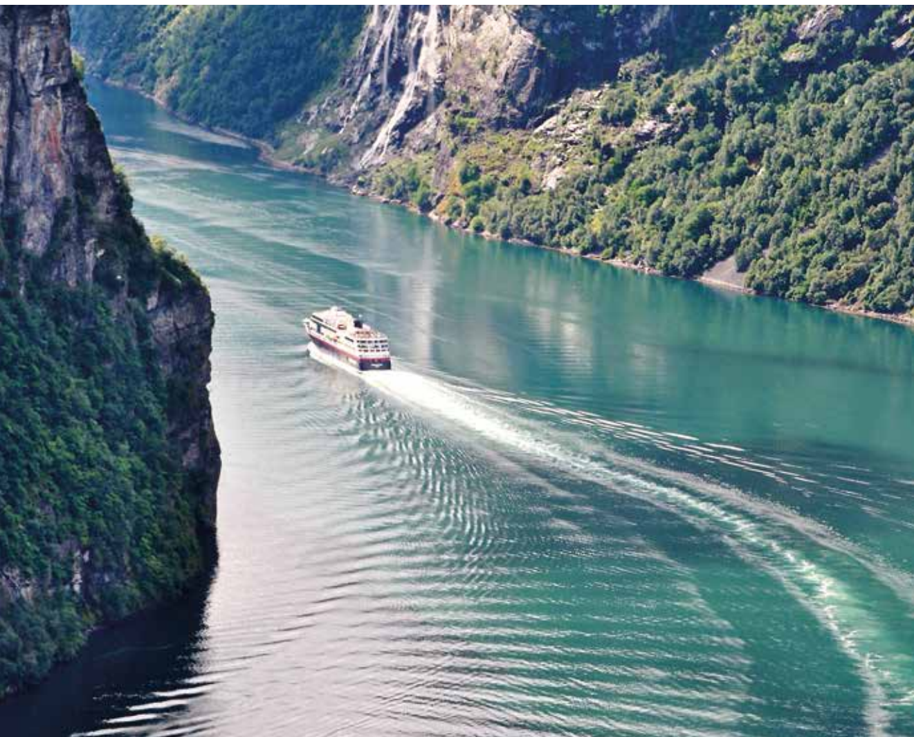
De norska fjordarna räknas till världens främsta turistattraktioner. Här passerar Midnatsol genom Geirangerfjorden.