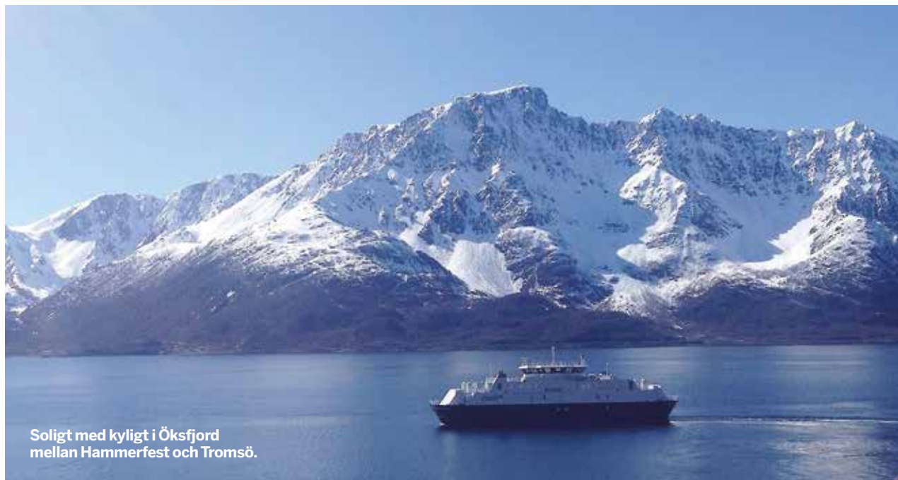
Soligt med kyligt i Öksfjord mellan Hammerfest och Tromsø.