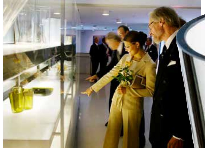
Kronprinsessan Victoria visar intresse för en av Aalto-vaserna på Alvar Aaltomuseet, under ett statsbesök.