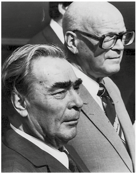
Det är anmärkningsvärt tyst om den mest långvarige finländske presidenten, Urho Kekkonen, under jubileumsåret. Hans nära kontakter med de sovjetiska ledarna, på bilden Leonid Brezjnev, har ifrågasatts.